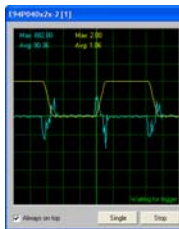
Коэффициент P в норме

Установите Канал 1 осциллографа на 'Iq Current' (ток, пропорциональный крутящему моменту). Установите масштаб Канала 1 осциллографа чтобы можно было наблюдать кривую тока Iq.