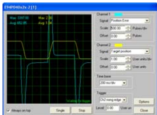
Коэффициент P контура положения слишком мал

Постепенно повышайте коэффициент Position P-Gain, наблюдая за кривой ошибки позиционирования на («Канале 1») осциллографа. При повышении коэффициента P-Gain должно быть заметным уменьшение этой ошибки. В определенный момент при повышении коэффициента P-Gain на кривой графика должен возникнуть колебательный переходный процесс. Когда это произойдет, начните повышать коэффициент D-Gain для подавления колебаний. Продолжайте повышать коэффициент P-Gain, а также подавлять колебания при помощи D-Gain до тех пор, пока повышения коэффициентов не перестанут сказываться на графике ошибки позиционирования.